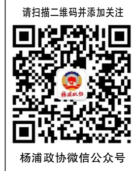
杨浦政协微信公众号